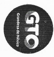
Tabla de aplicabilidad de obligaciones de transparencia 2021 Xichú, Gto Unidad administrativa: Medio Ambiente y Turismo

HONORABLE AYUNTAMIENTO 2018//2021 Trabajando con DECISIÓN